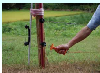
侵入防止柵の設置